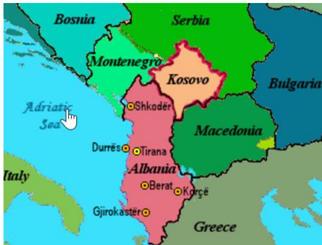
Figuur 1: Albanie/ Kosovo

Onder de bevolking in dit deel van Kosovo en Albanie heerst nog steeds grote armoede. De economische vooruitzichten zijn slecht en veel jongeren trekken weg op zoek naar een betere toekomst. Ouderen en weduwen blijven achter. Er is geen infrastructuur en de sociale voorzieningen ontbreken. Albanië is bovendien in geestelijk opzicht verarmd en berooid. Vóór het communisme was het gebied merendeels islamitisch en een klein deel rooms-katholiek. Onder het communisme waren beide godsdiensten verboden. Het land is nu grotendeels atheïstisch, er zijn nog wel culturele verschillen die voorkomen uit de religies van vóór de communistische overheersing.