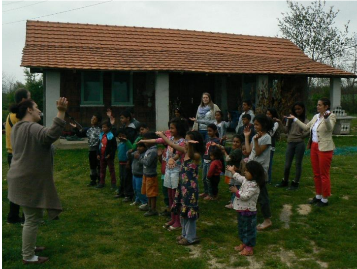
Kinderwerk in het Roma-dorp Janosh.