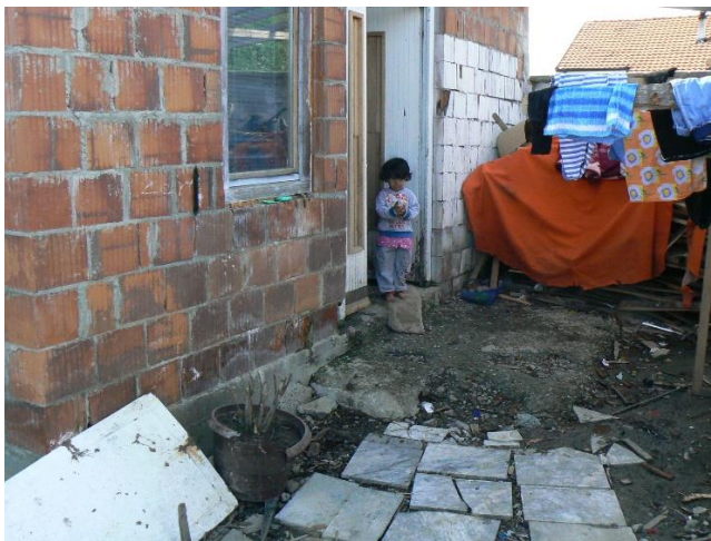
Arme Roma-gezinnen in Gjakova