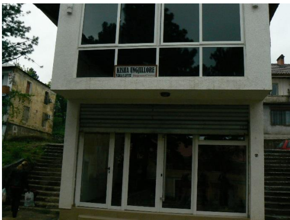
Nieuwe kerkgebouw van gemeente in Bajram Curri, centraal gelegen aan de hoofdstraat.